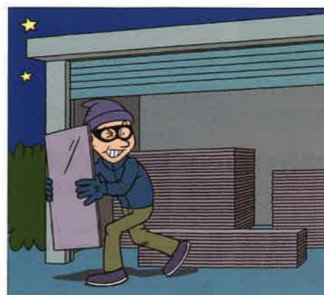
借用した敷鉄板を倉庫で保管中に盗難にあってしまった。

オプション3にご加入された場合、請負業者賠償責任保険部分の被保険者間の交差責任に関する補償範囲を拡大します。